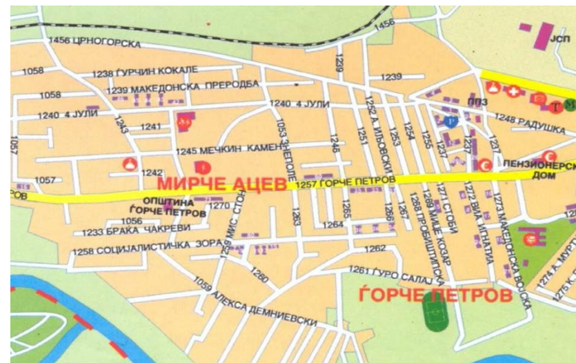
Општинско Основно Училиште “МИРЧЕ АЦЕВ” Ѓорче Петров, Скопје